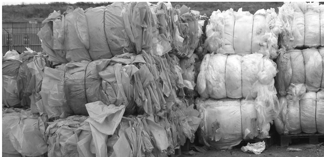
Plastové fólie z obalov potravín a iného spotrebného tovaru čakajú v takýchto niekoľko kilogramových balíkoch na svoje nové spracovanie. To, že sa dostanú na takúto kopu je tým najlepším prípadom, lebo príroda sa s ich rozkladom borí až niekoľko rokov.

(Dokončenie zo str.12) ďalej fóliu číru a farebnú jednodruhovou, HDPE materiál (kúpeľňová drogeria, ...), tvrdé plasty a ostatné plasty (igelitové tašky, rôzne farebné fólie). Na skládke odpadov skončia nerecyklovateľné druhy odpadov, alebo tie, na ktoré ešte nie sú koncoví spracovatelia druhotných surovín. Toto sú požiadavky od koncových spracovateľov druhotných surovín. Takto vytriedený odpad sa ďalej lisuje do štandardizovaných balíkov, čím sa pripravuje na expedíciu ku koncovému spracovateľovi. Koncoví spracovatelia z tohto materiálu vyrábajú hotové výrobky, alebo polotovary určené na ďalšie spracovanie."