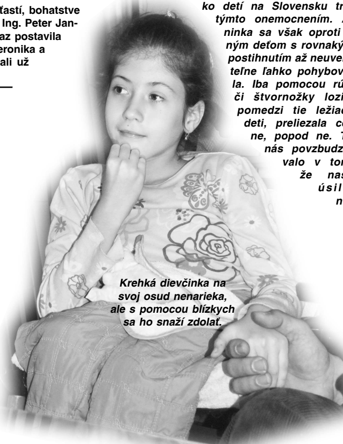
Krehká dievčinka na svoj osud nenarieka, ale s pomocou blízkých sa ho snaží zdoлаť.