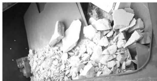
Tam, kde mal byť papier, nasypal niekto suť. Nevie dotýčný čítať alebo je "antiokológ"?

Čo sem nepatrí: drôtené a olovené sklo, auto-sklo, porcelán, keramika, žiarovky, žiarivky, kryštál, iné prímеси komunálneho odpadu.