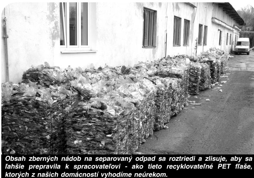
Obsah zberných nádob na separovaný odpad sa roztriedi a zlisuje, aby sa ľahšie prepravila k spracovateľovi - ako tieto recyklovateľné PET fľaše, ktorých z našich domácností vyhodíme neúrekom.

vodcu odpadu, čiže od občana. Pôvodcom odpadu je každý, koho činnosťou odpad vzniká, to znamená aj občan mesta Veľký Krtíš.