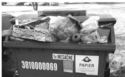
Tak to nie, milí spoluobčania, komunálny odpad patrí do úplne inej nádoby.

PET Fľaše: fľaše od nealko nápojov, vína, sirupov, HDPE fľaše sú fľaše od saponátov, šampónov, aviváže, mydiel, destilovanej vody, pleťovej vody a pod. Tretím druhom plastových