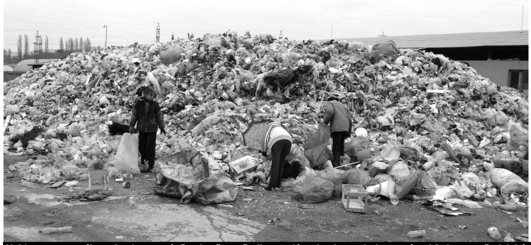
Halda separovaného odpadu vyzerá, že si s ňou už nikto nedá rady. Je to ale len prvý pohľad a navyše laický.