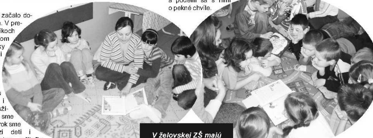
V želovskej ZŠ majú každoročne „Týždeň hlasného čítania“