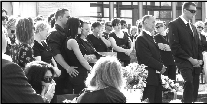
... lúčia sa s Tebou Tvoji príbuzní, priatelia ale najmä nekonečným žiaľom zasiahnutí rodičia a brat.“