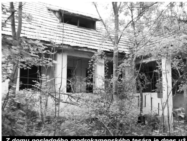
Z domu posledného modrokamenského tesára je dnes už len spustnutá a schátraná stavba...