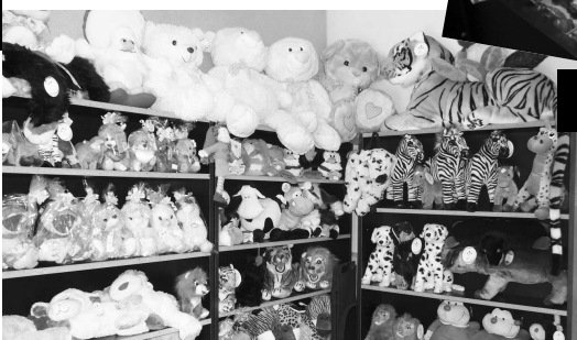
Všetkými vekovými kategóriami obľúbené plyšové hračky sú v ponuke v rôznych podobách a farbách.

Dievčatám je určený veľký výber bábik, samostatné, s oblečením, prípadne inými doplnkami. Samozrejme nechýbajú bábiky Barbie, kolíska pre bábiky, kočíky, šijacie stroje, žehličky, všelijaké kuchynské spotrebiče, ako napr. kávovary, mikrovlnky, atď. Takisto si