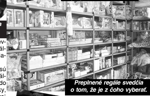
Preplnené regále svedčia o tom, že je z čoho vyberať.

S blížiacim sa letom nastáva čas na športovanie, a tak je už v tomto období predajňa zásobená rôznymi druhmi lopt - futbalovými, basketbalovými, gumenými, nafukovacími, ďalej je možné kúpiť bedminton a už aj nafukovacie bazény, nafukovačky, plávajúce kolesá, rukávniky, i nafukovacie člny.