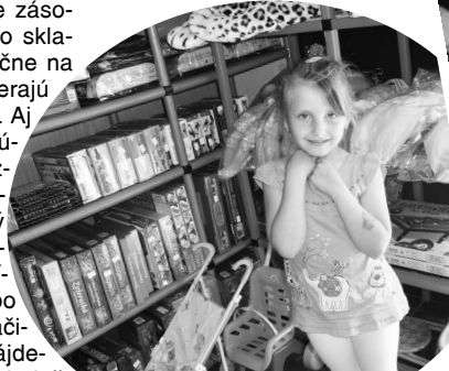
V hračkárni si určite prídu na svoje všetky deti.

Hračkáreň je dostatočne zásobená tovarom, berie ho zo skladov, ktoré pôsobia dlhoročne na slovenskom trhu a zaoberajú sa hračkami 15 - 20 rokov. Aj z tohto dôvodu možno vylúčiť, že by tu mali nebezpečné hračky. Pre chlapcov je v predajni široký sortiment hračiek, ako napríklad rôzne druhy autíčok, či už obyčajné alebo na diaľkové ovládanie, vláčiky na baterky, traktory. Nájdete tu pracovné náradie, skladačky, i s kovovými skrutkami, legá, autodráhy, ale aj sety - indiánov, vojakov, zvieratiek, či modelár-