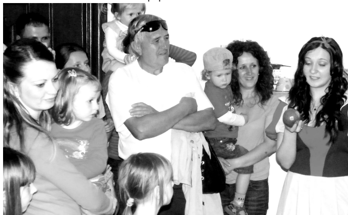
Najväčšiu radosť robili deťom rozprávkové postavičky v expozíciách

tmení sa premieta rozprávkový film Karlik a továrneň na čokoládu a k spetseniu večera rozhodne prispeli aj účinkujúci s fireshow." Návštevníci sa mohli popre-