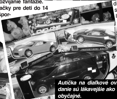
Autíčka na diaľkové ovládanie sú lákavejšie ako tie obyčajné.

dielných spoločenských hier, stávkové hry - Svet dostihov, Investor. Rôzne druhy kariet - sedmové, kvarteto, pexeso, čierny Peter, žolík. Pre menšie deti sú to Domčeky, Rozprávková cesta, Tom a Jerry.