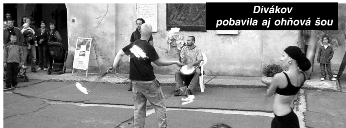
Divák pobavila aj ohňová šou

chádzať na bašte, navštíviť kaplnku hradu, kde je aktuálne výstava obrazov s názvom Rožňavská metercia, či výstavu Zo života škriatkov, ktorá je na hrade už od 6.4. a potrvá až do 30. 9. Je to interaktívna výstava o svete škriatkov, ktorí tiež patria do rozprávkovej ríše. Deti sa môžu samé hrať, vážia sa, merajú podľa škriatkov a objavujú ich skrýše. Medzi atrakcie patrí aj domeček pre škriatkov či baňa s permoními. V najbližšej dobe organizuje hrad podujatie venované opäť deťom, ktoré sa uskutoční 31.5. pod názvom Stredoveký deň detí. Na nádvorí sa odohrajú rôzne historické hry, skúšky pre rytierov ako je šermovanie, lukostrelba a pod. a ich následné pasovanie za rytierov. Pomedzi to budú otvorené tvorivé dielne, kde si vyskúšajú remeslá, ako rezbárčinu či modelovanie na hrničarskom kruhu. -red-