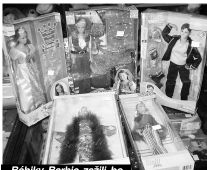
Bábiky Barbie zažili boom v 80-tych rokoch, ale stále sú žiadanými.

Z plyšových hračiek sú to klasické plyšáky rôznych druhov a farieb, či už medvedíky, zajačiky, čertíci, opice. Zaujímavé sú hračky, ktoré vydávajú