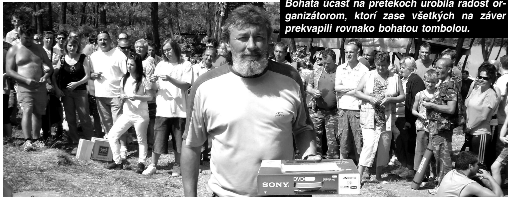
Bohatá účasť na pretekoch urobila radosť organizátorom, ktorí zase všetkých na záver prekvapili rovnako bohatou tombolou.