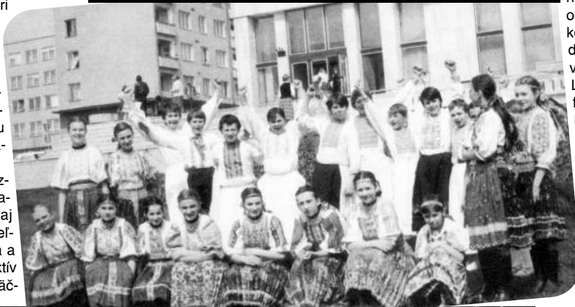
Perlička v osemdesiatych rokoch (hore) a na Spievankách 87 vo V. Krtíši