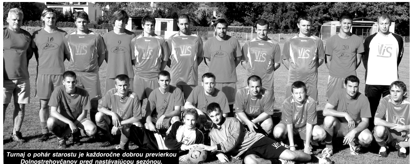
Turnaj o pohár starostu je každoročne dobrou previerkou Dolnostrehovčanov pred nastávajúcou sezónou.