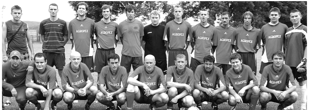
Futbalový klub Sklabiná získal v V.lige sk.D bronz. Okrem tohto krásneho úspechu sa teší aj vernému fanklubu (na foto dole), ktorý na svojich hráčov neďá dopustiť

Stretnutie tak skončilo hokejovým výsledkom 5:5, ktorý bol z pohľadu