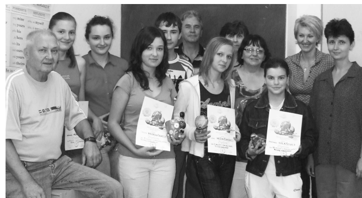
Z okresného kola súťaže Mladý záhradkár si odniesli pekné ceny všetci žiaci, ktorým držali palce organizátori súťaže aj pedagogický zbor.