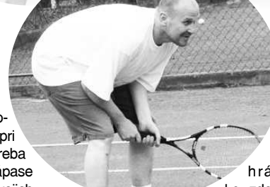
hrávke zdolala skúsenú