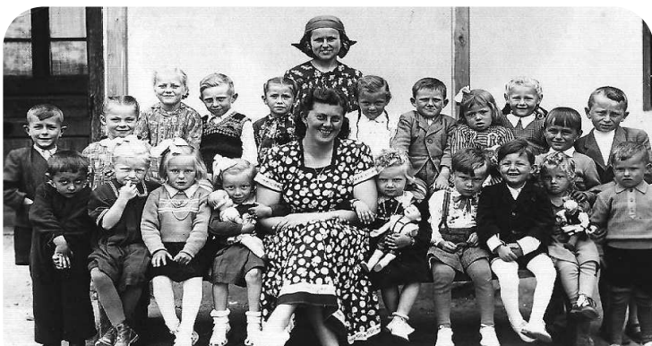
Najstaršia fotografia na výstave bola z roku 1952

" Výstava MOJE NAJKRAJŠIE ROKY bola určite jedna z najkrajších a najpodarenejších akcií OZ ZASE. Kto neprišiel, môže ľutovať. Lebo každý nemá doma fotografie, aké boli vystavené na tejto jedinečnej akcii. Spomienky pri pohľade na staré fotky zaleteli veľmi ďaleko. A kto svoju fantáziu spomienok úplne odviazal (hlavne tí starší), určite sa mu v oku objavila slzička, ktorá mu pripomenula, že toto boli bezstarostné dni života. ĎAKUJEM."