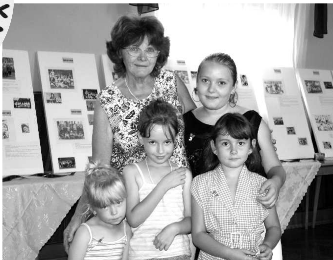
Pokochať sa fotografiami prišli aj celé rodiny.

Realizácia si vyžiadala nemálo úsilia pri zozbieraní fotografií, triedení, popisani a samotnej inštalácii. Ale výsledok stál za to. Sála kultúrneho domu premenená na výstavnú sieň s radosťou a v očakávaní víťala každého návštevníka. Prejdúc od začiatku výstavných panelov po samý koniec akoby uplynulo 57 rokov. Veď najstaršia fotografia pochádzala z roku 1952. V pamätnej knihe pribúdali podpisy i odkazy. Prišli malí i starí, páriky ruka v ruke i celé rodiny.... Bolo zadostučinením vidieť, ako ľudia so záujmom hľadali na fotkách známe tváre, pripomínali si mená a dopĺňali údaje v popisoch fotiek. Ako sa na jednom mieste "stretli 3 - 4 generácie". (Škôlkarka stará mama (z roku 1952), syn škôlkar- vnuk škôlkar - pravnuk škôlkar (z roku 2009). Krásne a