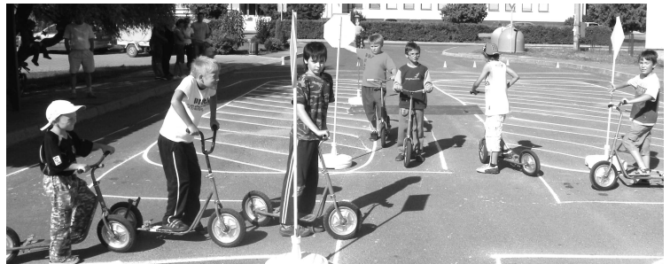
Pre deti bolo pripravené improvizované dopravné ihrisko

Na ihrisku TJ Prameň Dolná Strehová sa podľa odhadu organizátorov stretlo vyše 500 ľudí. Počas celého dňa tam vládla dobrá nálada pri skvelom športovom zážitku a navyše pri občerstvení a guláši, ktoré boli pre domácich obyvateľov zadarmo.