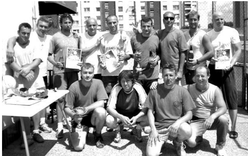
Učastníci odborárskeho nohejbalového turnaja

Už po štvrtýkrát usporiadali odborári zo Základnej organizácie, Odborového zväzu polície V. Krtíš nohejbalový turnaj najsilnejších odborových zväzov v okrese. Na tenisových kurtoch TJ ELÁN V. Krtíš sa v pondelok 13.7. na IV. ročníku turnaja predstavili mužstvá odborových organizácií baníkov, plynárov, policajtov a hasičov. Každá organizácia mohla postaviť dve mužstvá, ale hasiči a plynári vzhľadom na dovolenky postavili len jedno, a ako náhradníci nastúpili mladé policajné nádeje. V základných skupinách sa trojčlenné družstvá stretli každé s každým a do semifinále postupovali prvé dva.