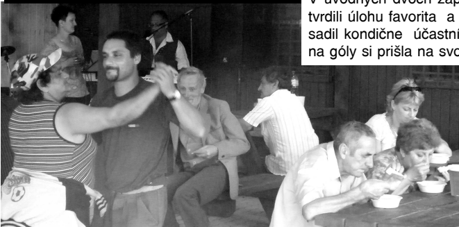
Na ihrisku hrala živá hudba. Niektorí neodolali a jednoducho sa pri jej tónoch vyzvírali do vôľa.

V úvodných dvoch zápasoch sa zrodili rovnaké výsledky, v ktorých obidve štvrtligové mužstvá potvrdili úlohu favorita a s prehladom zvíťazili pri ťažšom rozbiehaní sa. V stretnutí o 3. miesto sa presadil kondične účastník zvolenského oblastného futbalového zväzu Dudince a v zápase bohatom na góly si prišla na svoje aj značná divácka kulisá. (Pokračovanie na str.19)