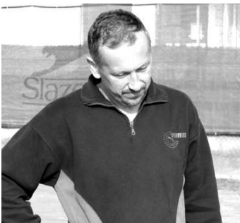
J.Šimun stále bojuje o postup do II.ligy

T.Brezinský/L.Matikovský- J.Danko/L.Hornýk 3:6,3:6