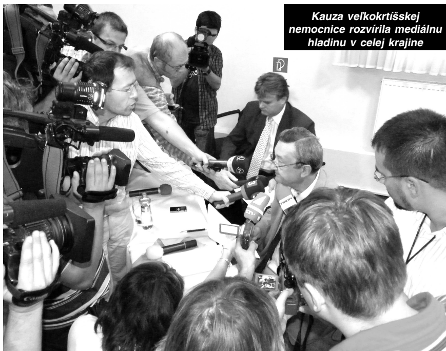
Kauza veľkokrtíšskej nemocnice rozvírila mediálnu hladinu v celej krajine

Na záver svojho vyhlásenia pred novinármi MUDr. M. Vachula 23. septembra uviedol: "Nová správna rada je legitímna. Podala pomocnú ruku a dokázala sa postaviť proti bohatým a vplyvným skupinám. Nie je pravdou, že vklad do katastra bol prekazeny súčasnými "záchrancami". Nemocnicu neovládla mafia ani žiadna politická strana. Z mojej strany boli teda podané viaceré trestné oznámenia a žiadosti o predbežné opatrenia na Okresný súd vo V. Krtíši. Chceme plne spolupracovať s políciou na uzavretí tohto stavu. Budem rád, ak médiá o tejto kauze budú informovať pravdivo a neskreslene a takou silou, akou tento škandál vznikol." -red-