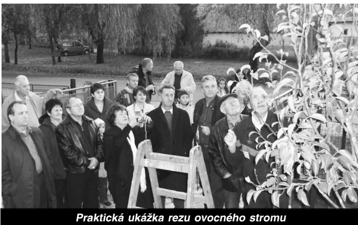
Praktická ukážka rezu ovocného stromu