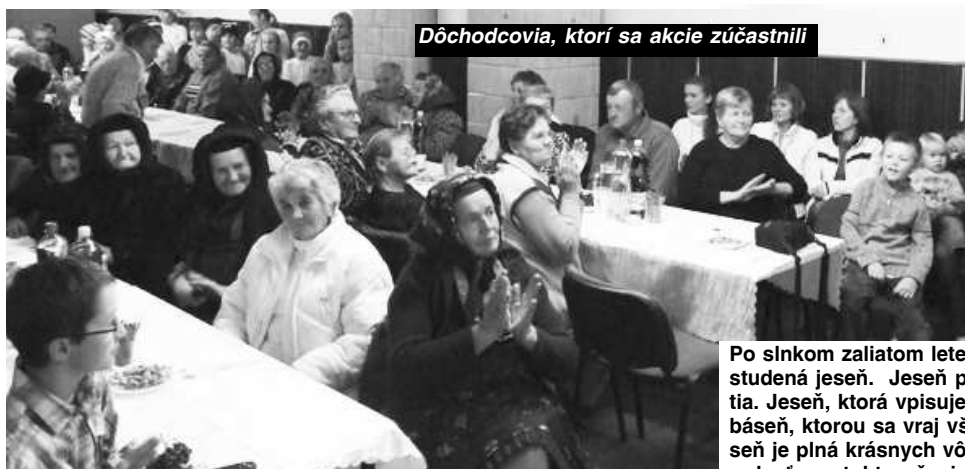
Dôchodcovia, ktorí sa akcie zúčastnili