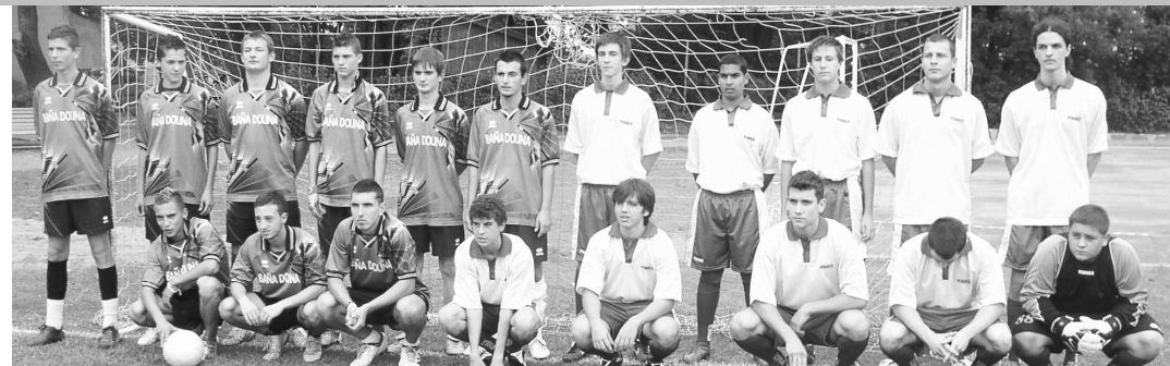
Žiaci zo Szécsény sa stretli vo futbalovom zápase so žiakmi SOŠ vo V.Krtíši

Začiatkom tohto školského roka sme v aktivitách spolupráce medzi školami pokračovali a v priebehu niekoľkých týždňov sme uskutočnili aktivity, ktoré vychádzajú zo vzájomnej dohody a hlavne korešpondujú so vzájomným chcením a jednak aj s potrebou realizácie školského života.