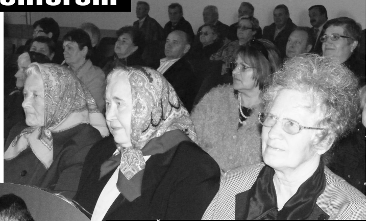
Ani v Želovciach nezabúdajú na dôchodcov