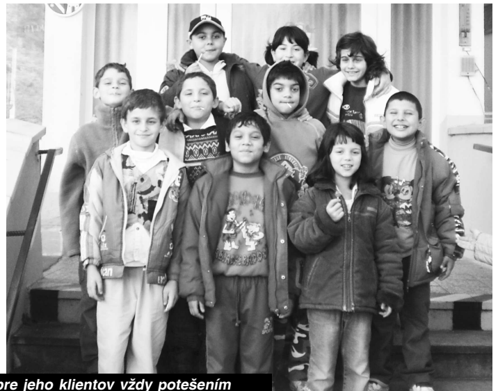
Deti v domove dôchodcov sú pre jeho klientov vždy potešením