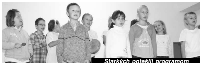
Starých potešili programom detí z miestnej MŠ a ZŠ.