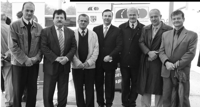
Ochotne nám zapózovali aj niektorí vodiči, na plecích ktorých je zodpovednosť za bezpečné dopravenie cestujúcich do cieľa.