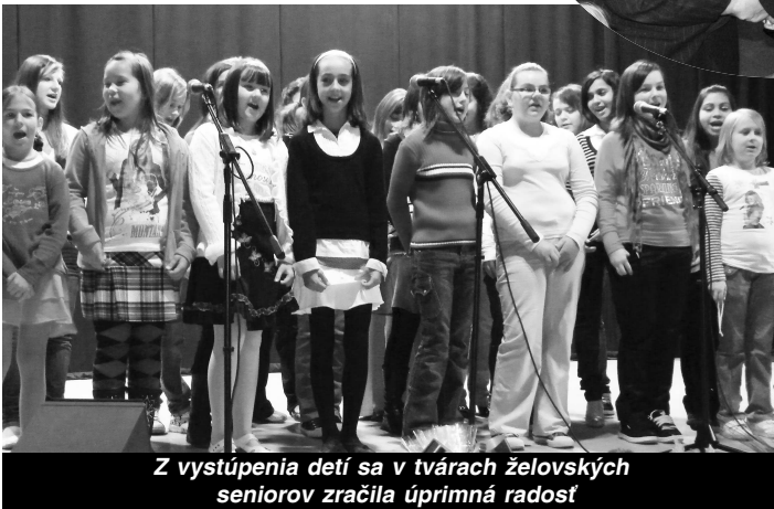
Z vystúpenia detí sa v tvárach želovských seniorov zračila úprimná radosť