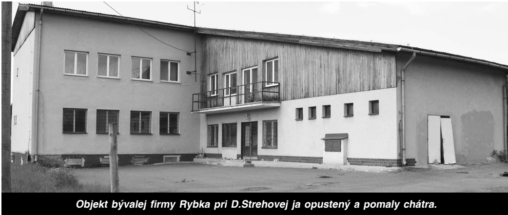
Objekt bývalej firmy Rybka pri D.Strehovej ja opustený a pomaly chátra.

votom, dá sa povedať, toho kriminálnika. Počas môjho pobytu sa niektorí aj trikrát vrátili.