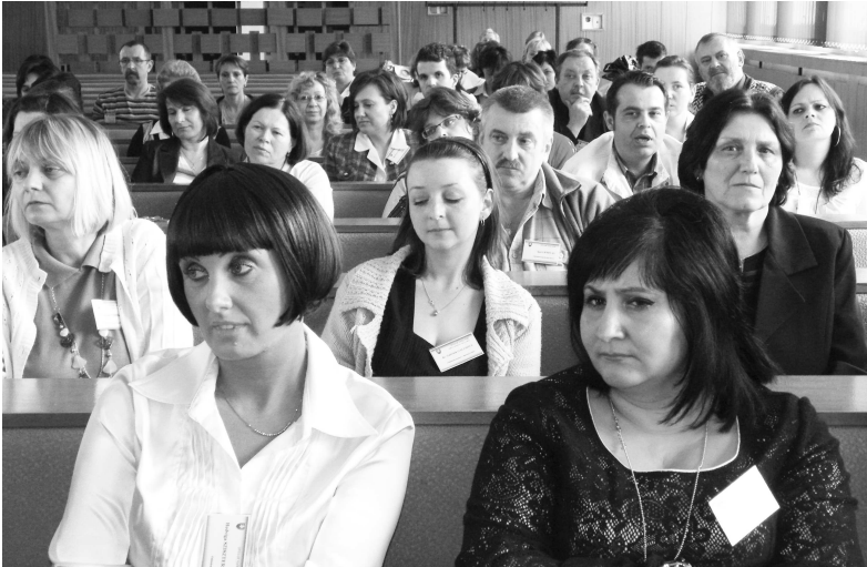
Niektó si povie: "Čože je to úradnícka robota!?" Ibaže všetci, ktorí pracujú s ľuďmi, vedia, že psychicky náročnejšej niet... a vedia to aj naši pracovníci ÚPSVaR V.Krtíš, ktorí sa s ministerkou podelili so svojimi skúsenosťami.

Nastavenie sociálneho systému by bolo najlepšie, najhumánnejšie a najspravodlivejšie, keby sa mohlo riadiť pravidlom z rozprávky o