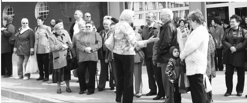
Ministerka Viera Tomanová väčšinu svojho profesného života venovala sociálnej práci, kde za každým prípadom vidí konkrétneho človeka.

Vo svojom programovom vyhlásení sa Vláda SR zaviazala, že základným cieľom jej sociálnej politiky bude poskytovať občanom Slovenskej republiky taký sociálny program, ktorý bude garantovať udržanie a rozvoj ľudských, hospodárskych, sociálnych a kultúrnych práv smerujúcich k dôstojnej životnej úrovni každého človeka. Systém sociálnej politiky je nastavený tak, aby bol čo najspravodlivejší, transparentný, trvalo finančne udržateľný, a aby zabezpečil rovnosť príležitostí.