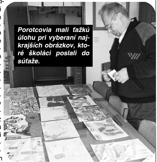
Porotcovia mali ťažkú úlohu pri vyberaní najkrajších obrázkov, ktoré školáci poslali do súťaže.