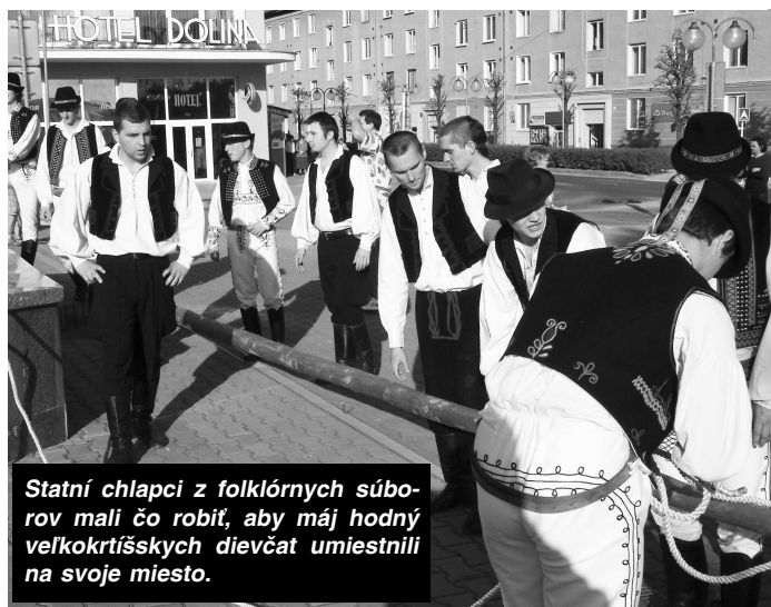
Statní chlapci z folklórných súborov mali čo robiť, aby máj hodný veľkokrtíšskych dievčat umiestnili na svoje miesto.