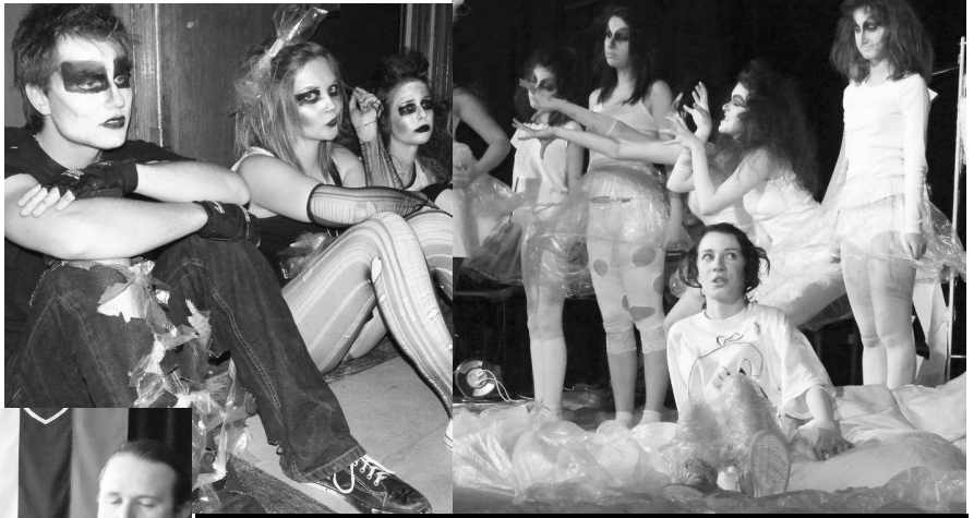
Mladí Veľkokrtišania zaujali aj nápaditosťou kostýmov a scény.