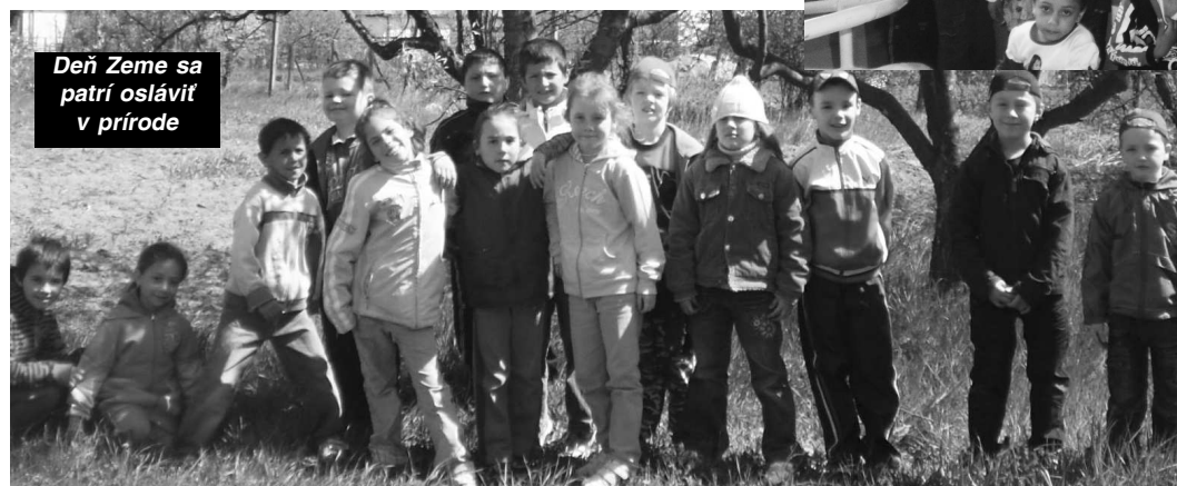
Deň Zeme sa patrí osláviti v prírode

li sme sa na posledných vyučova- cích hodinách priamo do lona prí- rody. Pozorovali ju, ako sa mení na jar, hoci slniečko je ešte dosť skúpe na svoje teplé lúče. Ale prí- jemný pobyt na čerstvom vzduchu, veselé šantenie a hry, určite zane- chali milú spomienku na tento deň a všetci si budeme pamätať, že prí- roda, ktorá nás obklopuje ostane krásnou len a len vtedy, ak si ju budeme chrániť a zveľaďovať.