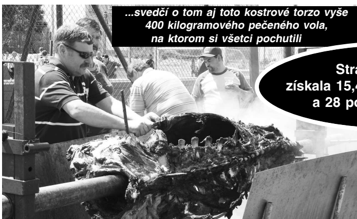
...svedčí o tom aj toto kostrové torzo vyše 400 kilogramového pečeného voľa, na ktorom si všetci pochutili

Strana SDKÚ - DS získala 15,42 % voličských hlasov a 28 poslaneckých kresiel