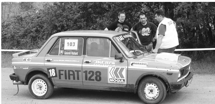
Stáva sa, že na jednom vozidle sa počas pretekov vystrieda celá rodina pretekárov