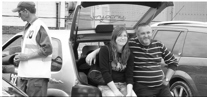
Odpočinok medzi dvomi kolami - na tomto aute jazdí na striedačku - otec s dcérou

všetkým ťažkostiam nedajú a vždy a znova sa vrhajú do ďalšej akcie. Podpora a sponzoring firiem ako aj v tomto prípade prispieva k vyššej úrovni a ohodnoteniu snáh pretekárov a víťazov. Najbližšie preteky na tejto trati budú VC CHEVROLETTE 20.6.2010. Zase sa máme na čo tešiť! -GaST-