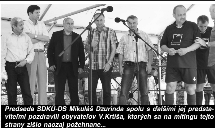
Predseda SDKÚ-DS Mikuláš Dzurinda spolu s ďalšími jej predstaviteľmi pozdravili obyvateľov V. Krtíša, ktorých sa na mítingu tejto strany zišlo naozaj požehnané...