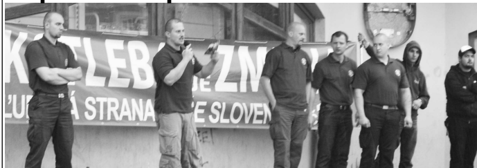
Dva týždne pred voľbami sa prezentovali so svojim volebným programom aj členovia Ludovej strany Naše Slovensko.