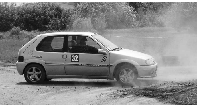
Prudké brzdenia a šmyky sú tými pravými čerešničkami na "rallytorte"