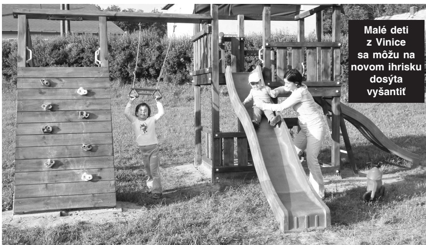
Malé deti z Vinice sa môžu na novom ihrisku dosýta vyšantiť

Vo viacerých obciach nášho okresu a aj vo Vinici sa rozhodli pre alternatívny zdroj energie. Na okraji obce už v týchto dňoch začína firma zaoberajúca sa využívaním slnečnej energie montovať fotovoltaické články, pomocou ktorých sa zo slnečnej energie vyrába energia elektrická.