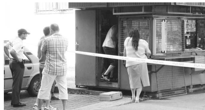
Stopy z lúpežného prepadnutia i výpoveď predavačky zaznamenávali vyšetrovatelia z OR PZ vo V. Krtíši