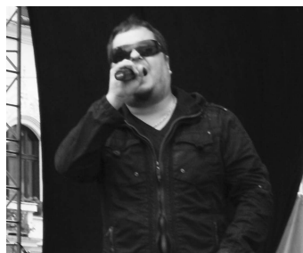
Zaspieval aj Kuly s Desmodom