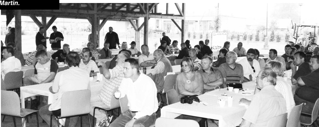
Účastníci podujatia so záujmom počúvali prezentácie jednotlivých šľachtiteľských spoločností, ktoré im sú nápomocné pri optimálnom výbere osív pre založenie úrody na jeseň.