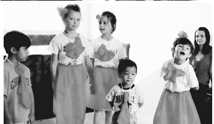
Deti si pre dospelých obyvateľov tábora pripravili kultúrny program.