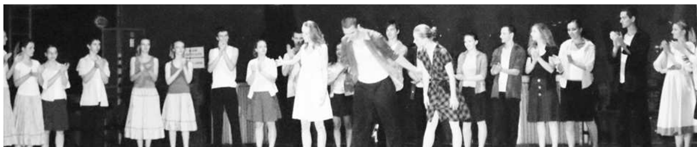
Približne dvadsiatka mladých tanečníkov dokázala udržať záujem takmer plnej veľkokrtíšskej sály kultúrneho domu počas vyše dvojhodinového koncertu.

Po prvej časti ukážok tanečného umenia nasledovala krátka prestávka. Počas nej sa javisko kultúrneho domu zmenilo na nepoznanie. Jeho strohá scéna - bez opôn i rekvizít reprezentovala to, čo súčasný tanec prezentuje. Pocitovosť a možnosť diváka vnímať tanec bez zbytočného rozptyľovania s možnosťou meditovať a nechať sa unášať tancom. Zaujímavou rekvizitou na javisku bol piesok tečúci tenkým prúdom (čas? prežitie príbeh?), s ktorým sa podchvíľou pohrávali tanečníci.