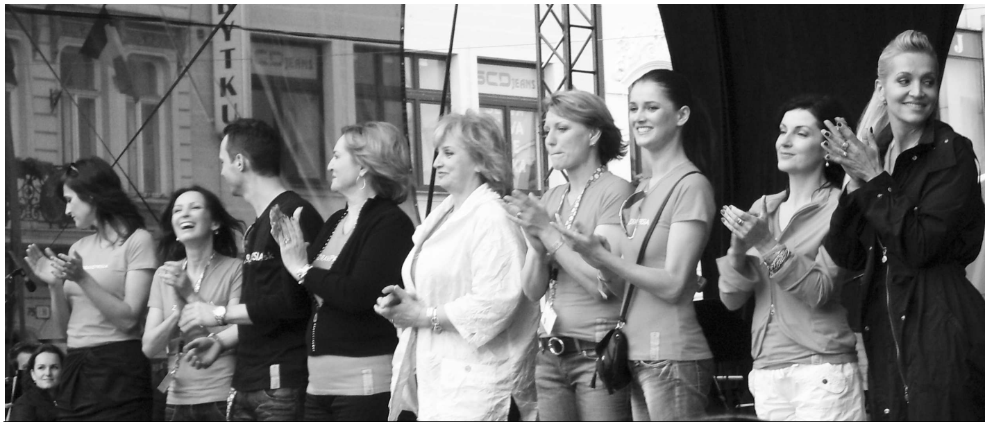
Boj proti rakovine prsníka podporuje mnoho žien slovenského šoubiznisu