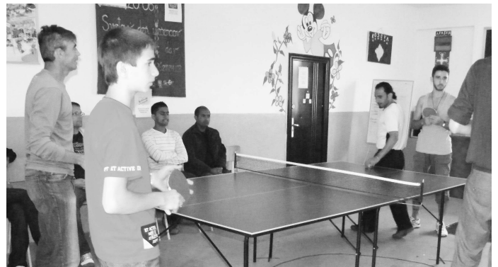
Stolnotenisový stôl nesmie chýbať ani v tomto zariadení a súťaže v ňom sú veľmi obľúbené a súboje napínané.