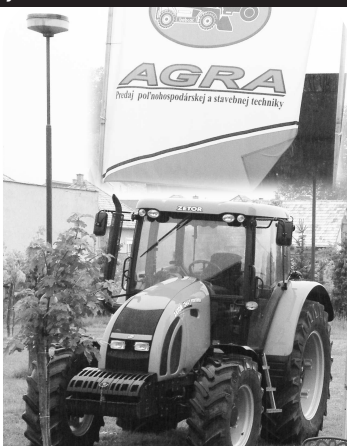
Poľnoteknikou sa vo Veľkej Čalomiji prezentovala aj spoločnosť AGRA, s.r.o., Martin.

Účastníci Dňa poľa si zároveň mohli prezrieť stroje od dodávateľov AGRA, s.r.o., Martin a AGRIO postrekovače, s.r.o., Poniky.