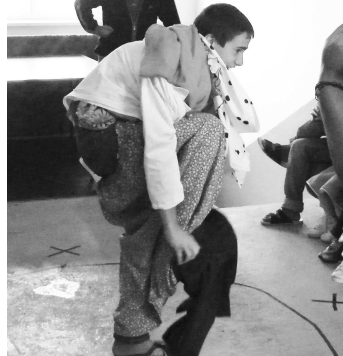
Pri súťaži "Oblec sa ako cibuľa", bolo veľa zábavy, najmä medzi divákmi.