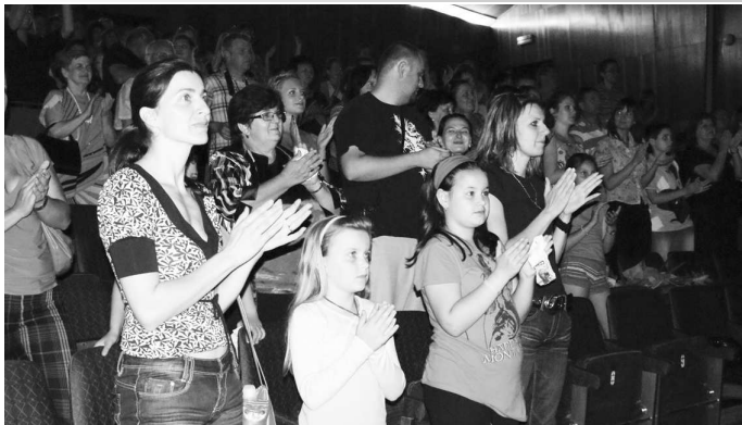
Diváci poďakovali za umelecký zážitok rodiacim sa hviezdikám tanečného neba, ktoré pochádzajú aj z nášho okresu.