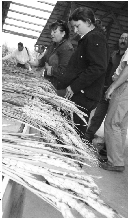
Prvý raz v histórii podujatia museli organizátori pripraviť "mokrú variantu" programu a priniesť trsy z pokusných poličok pod strechu amfiteátra.