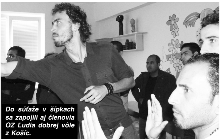
Do súťaže v šípkach sa zapojili aj členovia OZ Ľudia dobrej vôle z Košíc.