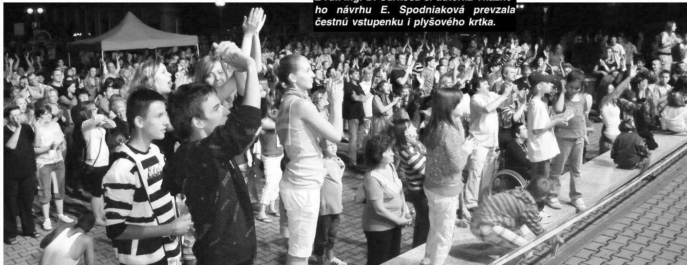
Skupina i P. Cmorík si získali divákov na preplnenom veľkokrtíšskom námestí.