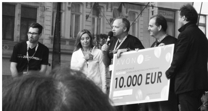
Kozmetická spoločnosť odovzdáva symbolický šek s hodnotou 10000 eur, ktoré budú určené na boj proti zákernému ochoreniu, ktoré postihuje veľa žien - rakovine prsníka