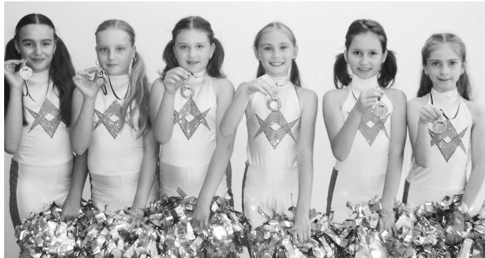
Majsterky SR 2010 v mini formácii Pom-pom