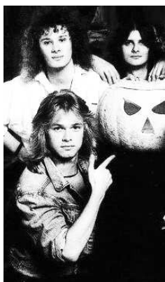
M. Kiske (vľavo dole) v roku 1987, v čase pôsobenia v skupine Helloween, s ktorou nahral nesmrteľné hity ako Future world či I want out .

Všetkým priaznivcom špičkovej rockovej muziky do pozornosti! Legendárny a fenomenálny hlas skupiny Helloween - Michael Kiske - sa po 17 rokoch vrátil na koncertné pódia. So svojou novou kapelou UNISONIC odohral skvelú show vo Švédsku, čaká ho festival Masters of Rock v českých Vizoviciach a na Slovensku - exkluzívne jediný koncert (z troch v rámci sveta) - môže potešiť svojich fanúšikov práve v našom okrese! Vďaka tomuto koncertu sa môže aj malý Veľký Krtíš zviditeľniť na hudobnej mape sveta! Mesto Veľký Krtíš vyšlo organizátorom v ústrety a poskytlo im priestory amfiteátra zdarma. Termín podujatia je pevne stanovený, hudobníci majú vyplatenú zálohu, organizátorom, bohužiaľ, odstúpil partner. Je tu teda obrovská šanca pre sponzorov z nášho okresu, ktorí by sa vďaka podpore dostali do povedomia celej krajiny, a po pokrytí nákladov by samozrejme neobišli naprázdno! Keďže sa počíta s tradíciou započatia festivalu vo V.Krtíši, v blízkej budúcnosti by sa ich sponzorstvo mohlo premeniť na zaujímavý zisk.