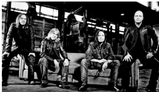
Michael (vpravo) s jeho novou kapelou Unisonic v roku 2010, s ktorou sa po sedemnásťročnej koncertnej pauze môže predstaviť aj vo V.Krtíši.

Podujatie je naplánované na 14.8.2010, pričom hlavnou hviezdou večera budú nemeckí AXIS, keďže UNISONIC, ako novovzniknutá skupina, aj napriek Kiskeho renomé, nechce hrať ako headliner. Mimoriadne vstupné bude pre najrýchlejších 11 eur, 13 pre ostatných. Keďže je pre toto podujatie naplánovaná celoplošná kampaň, očakáva sa účasť fanúšikov z celej republiky, ale aj zo zahraničia. Fest sa bude niesť pod záštitou agentúry EPG prod., a.s., ktorá na Slovensko pritiahla skupiny zvučného mena (Europe, Alice Cooper, Scorpions, Sepultura, Judas Priest, Helloween, či Kreator. Najnovšie chystá na november koncert Jeana Michela Jarreho, či Chrisa Normana). Všetky podmienky a informácie ohľadom novej sponzorskej podpory festivalu vo V.Krtíši získate na telefónnom čísle 0902 384 116.