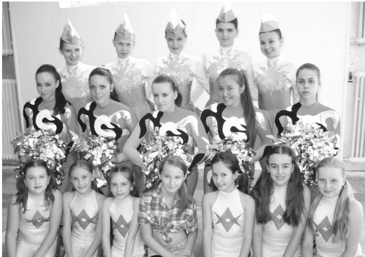
Úspešná zostava našich mažoretiek