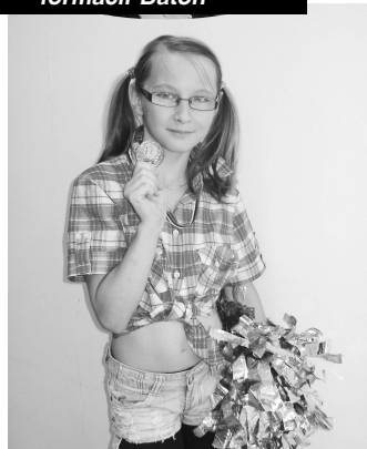
II. Vicemajsterka SR 2010 v sólo formácii Pom-pom