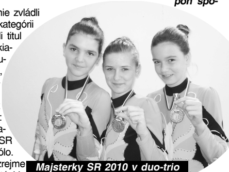
Majsterky SR 2010 v duo-trio formácii Baton