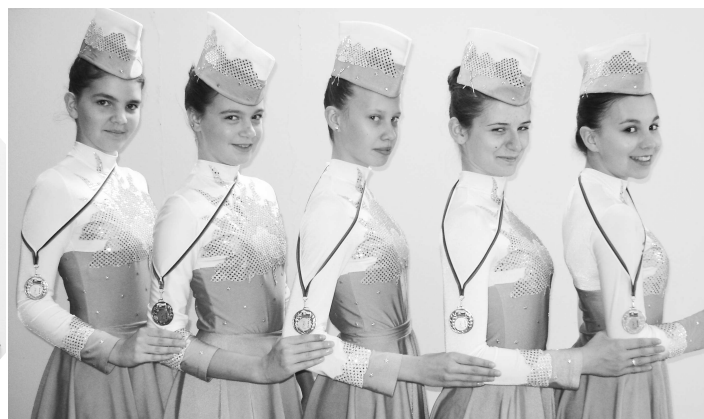
Majsterky SR 2010 v mini formácii Baton