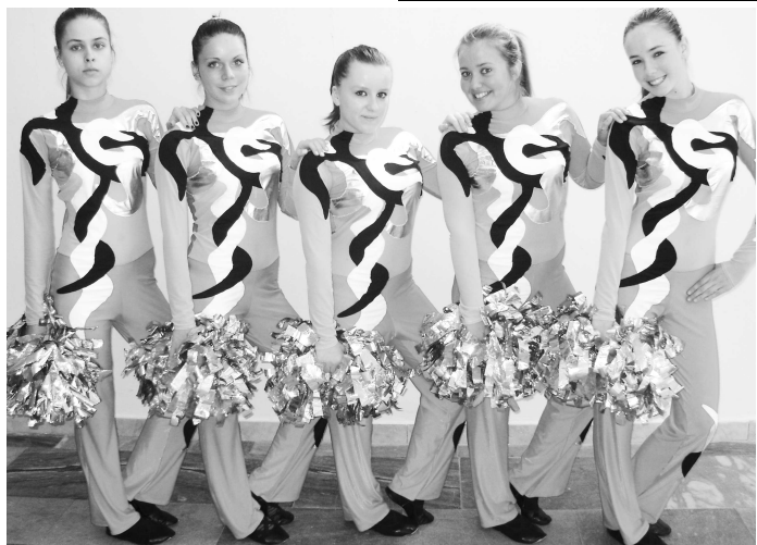
Za medailovými bránami ostali tieto dievčatá, chýbal im len kúsok... Obsadili štvrté miesto v mini formácii Pom-pom