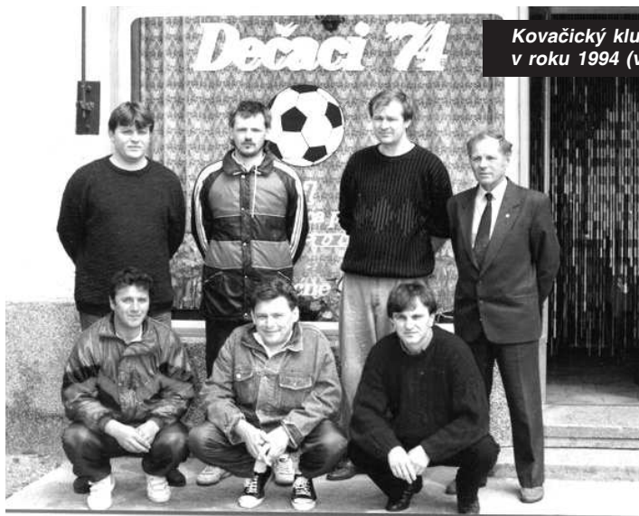
Kovačický klub Dečaci '74 v roku 1994 (vľavo) a 2004