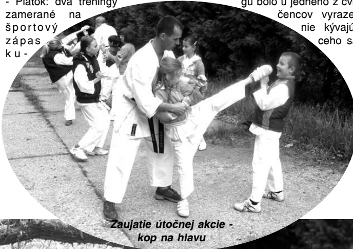
Zaujatie útočnej akcie - kop na hlavu

mite. Počas tréningov boli preberané základné techniky, obranné a útočné kombinácie a taktika zápasu, čo skončilo u niektorých i s nariadeným nosom. Kuriozitou tréningu bolo u jedného z cvičencov vyrazenie kývajúceho sa