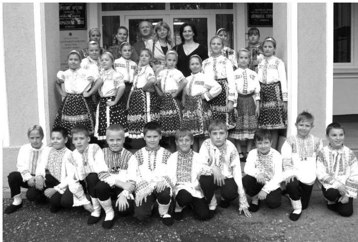
Prezidenta SR I.Gašparoviča na Dolnej zemi privítali mladí folkloristi

Ivan Gašparovič hovoril s našimi rodákmi aj o rôznych formách pomoci, ktorú poskytuje SR krajanom. Na stretnutie so slovenským prezidentom prišli aj slovenskí poslanci z vojvodinského i celoštátneho srbského parlamentu, ktorí sa poďakovali za rozvojovú pomoc SR najmä pri výstavbe infraštruktúry a podpore národnej kultúry vojvodinských Slovákov. Prezident sa stretol s kra-