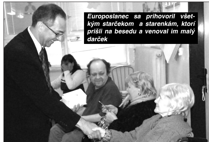
Europoslanec sa prihovril všetkým starčekom a starenkám, ktorí prišli na besedu a venoval im malý darček