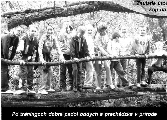
Po tréningoch dobre padol oddych a prechádzka v prírode