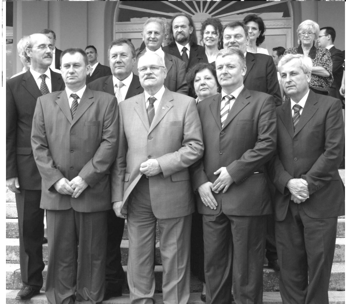
Spoločný záber prezidenta I.Gašparoviča s predstaviteľmi Kulpiny

kázali zachovať nielen jazyk svojich otcov, ale aj pôvodnú kultúru. "Je až neuveriteľné, koľko energie, voľného času a niekedy aj peňazí venujete na to, aby ste mali vlastné folklorne súbory a festivaly, vlastné divadlo, noviny a rozhlas a dokonca aj televíziu. Vaša obec sa preslávila v celom svete osobitnou, kovačickou maliarskou školou," zdôraznil v príhovore slovenský prezident. Na záver návštevy si prezident prezrel Galériu naivného umenia a miestnu televíziu, ktorá okrem srbského vysielala aj v slovenskom jazyku.