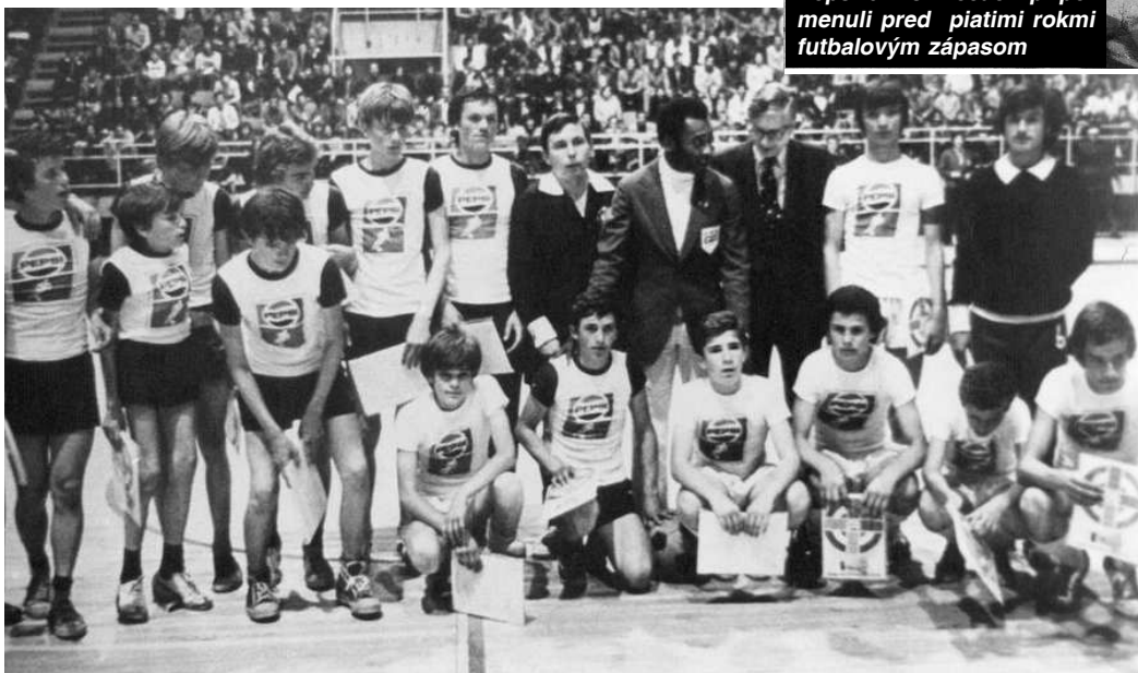
Takýmto záberom sa môže popýšiť málokto - vojvodinskí Slováci, mladí futbalisti z Kovačice sa zvečnili s kráľom futbalu Pelém

Úspech sa vždy začína odvahou. Triumf Dečakov, Slovákov zo srbskej Kovačice, sa zakončil