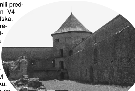
Pevnosť v Bzovíku skrývala najstarší erb rodiny Balašovcov.