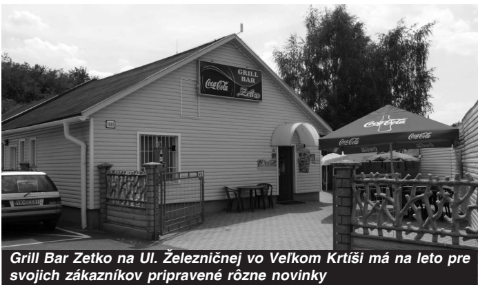
Grill Bar Zetko na Ul. Železničnej vo Veľkom Krtíši má na leto pre svojich zákazníkov pripravené rôzne novinky