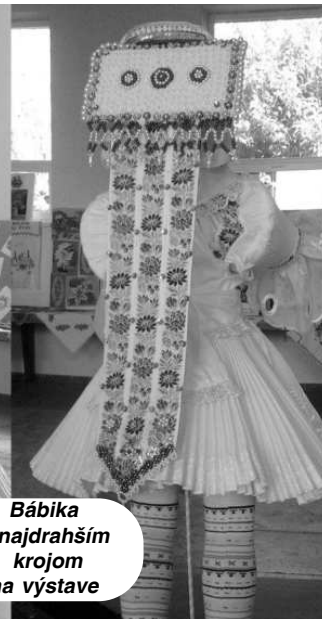
Bábika s najdrahším krojom na výstave

Práce našich šikovných obyvateľov Opatovskej N. Vsi videli turisti z Talianska, Francúzska, Rakúska i Maďarska. Obdiv si vyslúžili všetky exponáty, ale viacerých zaujal kroj bábiky za takmer 300 eur.