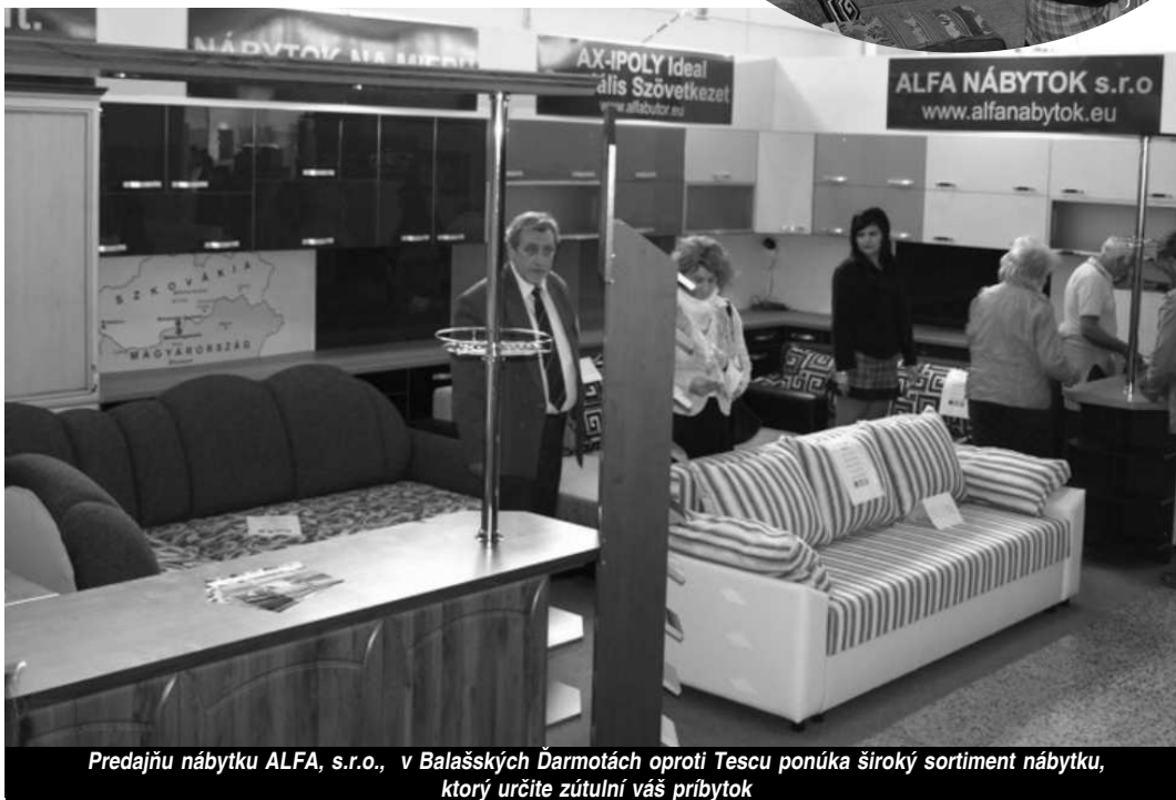
Predajňu nábytku ALFA, s.r.o., v Balašských Ďarmotách oproti Tescu ponúka široký sortiment nábytku, ktorý určite zútulní váš príbytok