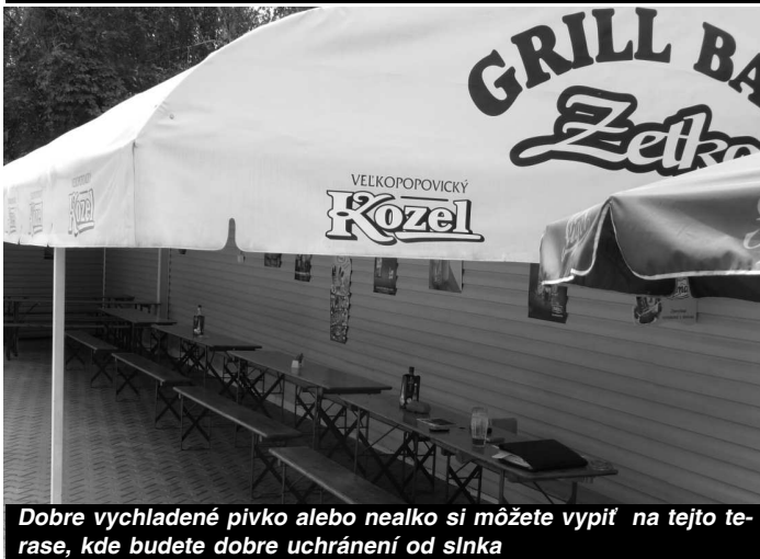
Dobre vychladené pívko alebo nealko si môžete vypiť na tejto terase, kde budete dobre uchránení od slnka