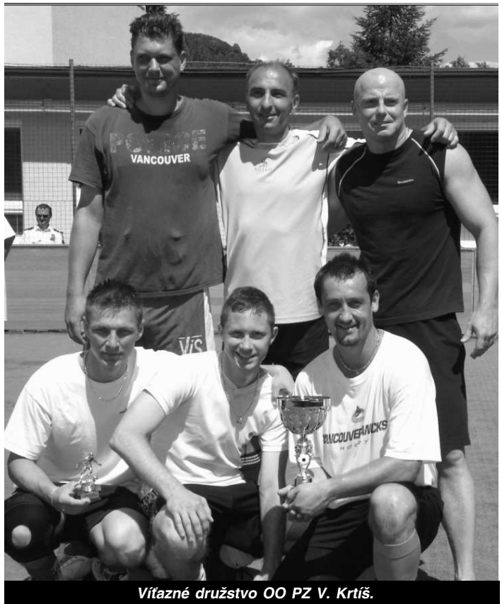
Vítané družstvo OO PZ V. Krtíš.