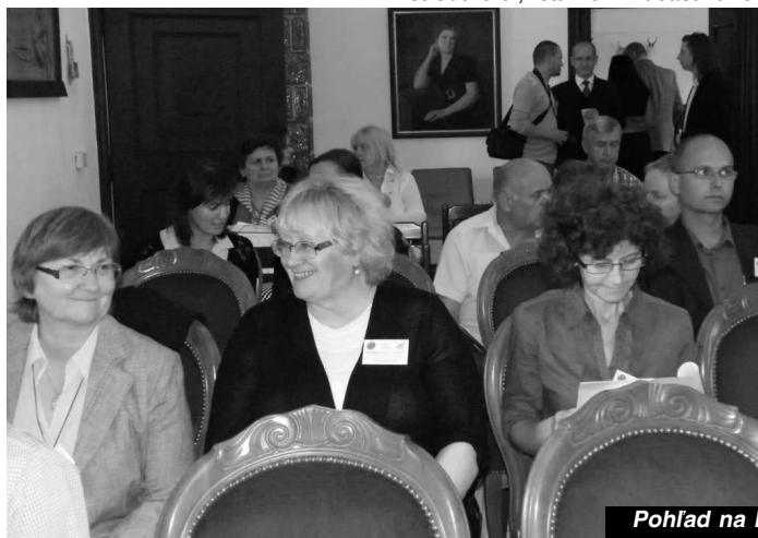
Pohľad na hostí konferencie