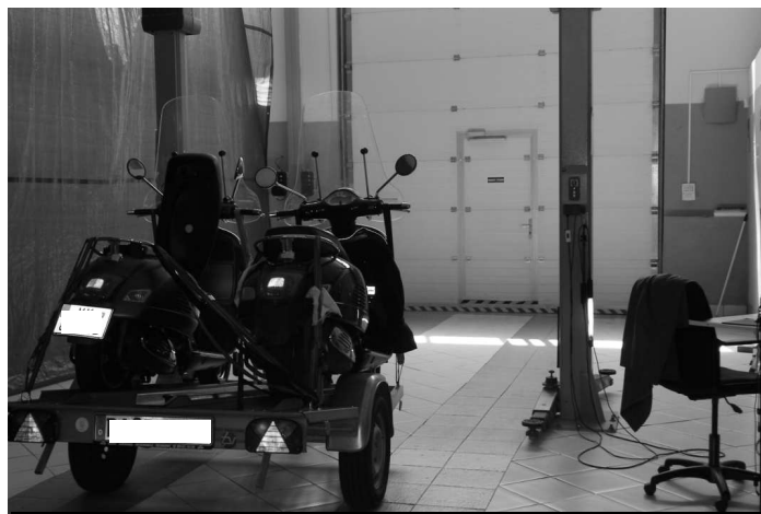
V týchto moderných priestoroch sa kontrolujú dovezené vozidlá

Originalitavk, s.r.o., V. Krtíš a sídli v moderných priestoroch na Baníckej ul. Otvorené majú od pondelka do piatku od 7:00 hod do 15.00 hod. Je dobré, ak sa na kontrolu vozidla dopredu objednáte. Mesačne tu traja kvalifikovaní a riadne zaškolení technici odhalia niekoľko priestupkov. Kontrolujú sa motocykle, štvorkolky, osobné i nákladné vozidlá prakticky z celej Európy i zá-