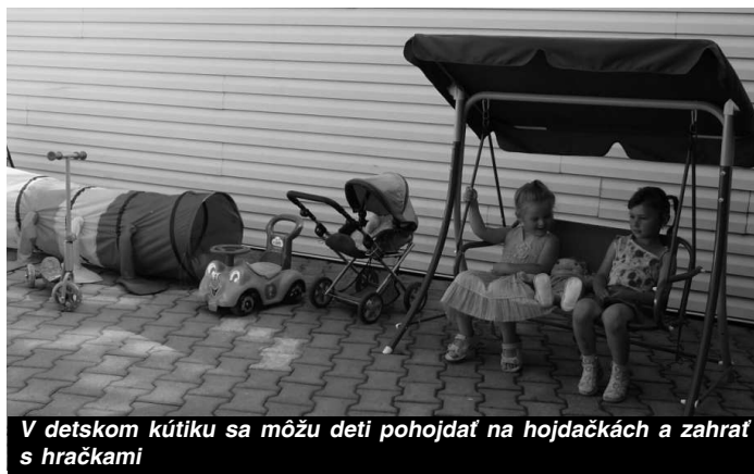
V detském kútiku sa môžu deti pohojdať na hojdačkách a zahrať s hračkami