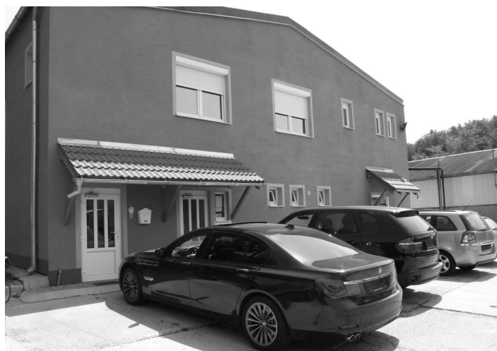
Ďalšie autá čakajú pred vstupnou budovou, kým ich skontrolujú pracovníci pracoviska originality identifikátorov

Mikroregión Východný Hont - OZ Obec Sucháň BBSK - Hontiansko - ipel'ské osvetové stredisko Veľký Krtíš Podpolianske osvetové stredisko Zvolen