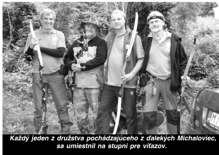
Každý jeden z družstva pochádzajúceho z ďalekých Michaloviec, sa umiestnil na stupni pre víťazov.