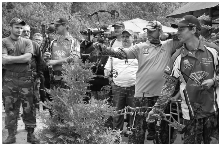
O poradí muselo často rozhodovať až rozstreľovanie jednotlivých súťažiacich.