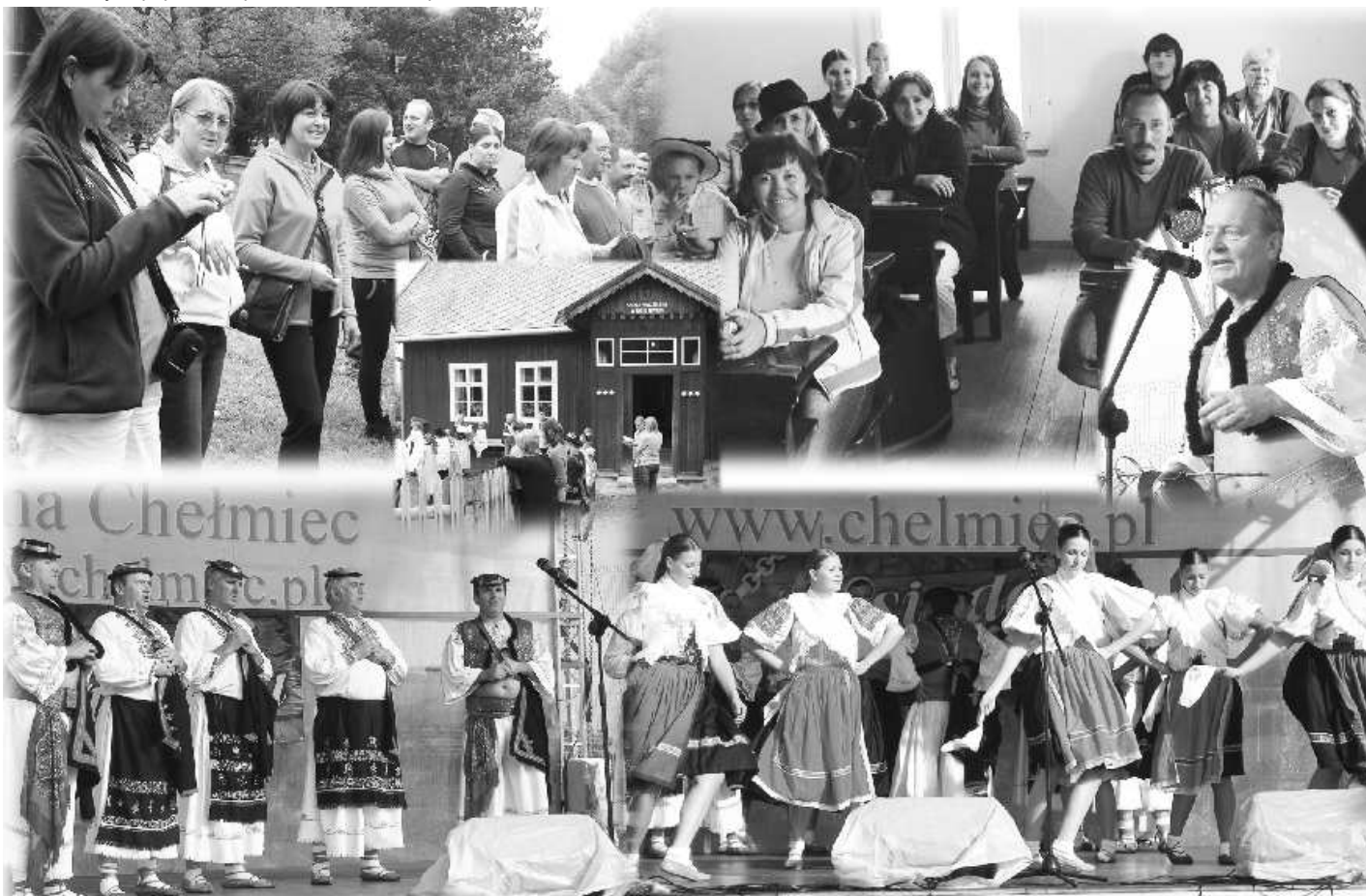
Folkloristi z Dolnej Strehovej aj napriek nepriazni počasia strávili pekný víkend v poľskom Nowom Saczi